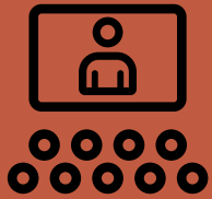
OBSERVACIÓN DE CASOS

de supervisión de casos. El contenido teórico se desarrolla durante el primer mes de clase y a través de seminarios impartidos por profesionales expertos a nivel internacional.