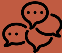
LABORATORIO DE COMUNICACIÓN